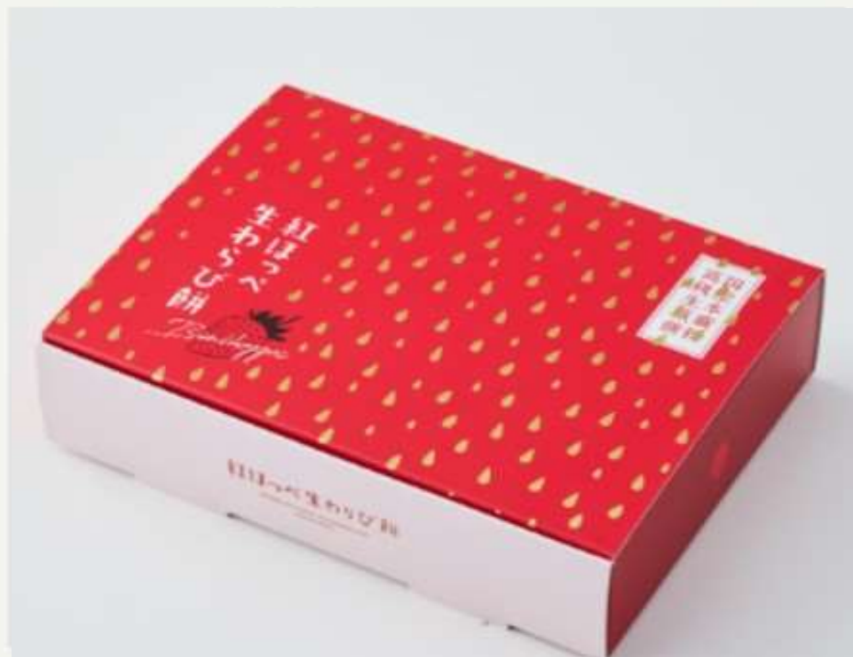
苺ソース(紅ほっぺ)用パッケージ