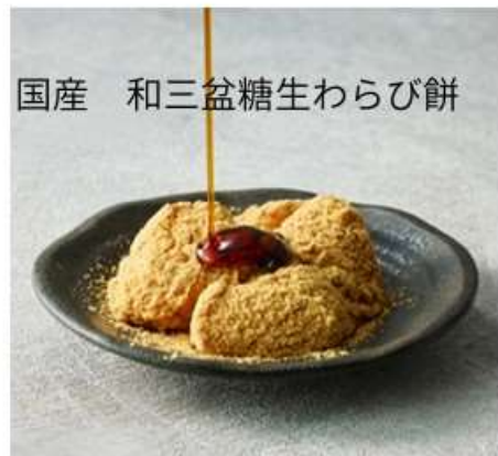
国産 和三盆糖生わらび餅