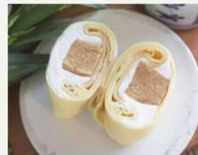
わらび餅 × クレープ