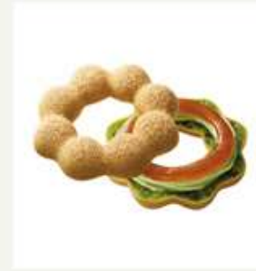
わらび餅 × ドーナツ