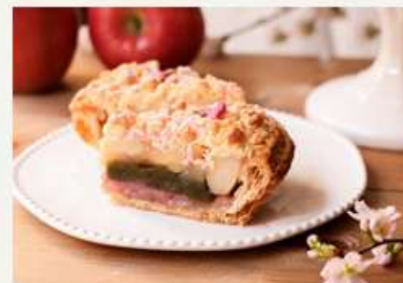
わらび餅 × アップルパイ