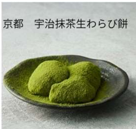
京都 宇治抹茶生わらび餅