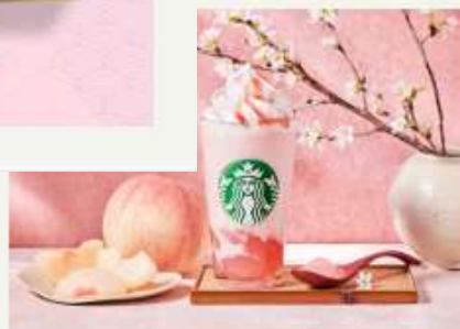
わらび餅 × フラペチーノ