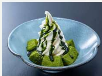
わらび餅 × アイス