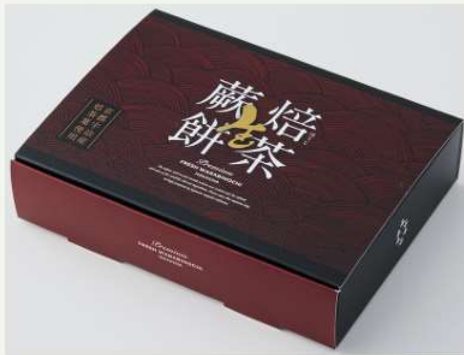
ほうじ茶用パッケージ