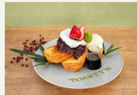
わらび餅 × フレンチトースト